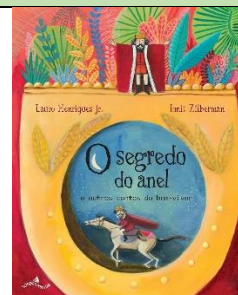
O Segredo do Anel e Outros Contos do Bem-viver Editora Tordesilhinhas 1ª Edição