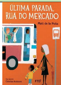
Última Parada, Rua do Mercado Matt De La Peña e Christian Robinson FTD Educação 1ª edição