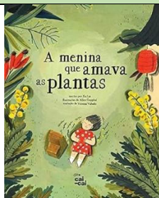
A Menina que Amava as Plantas Editora Cai-Cai 1ª Edição Xu Lu (Autor), Alice Coppini (Ilustrador), Verena Veludo (Tradutor)