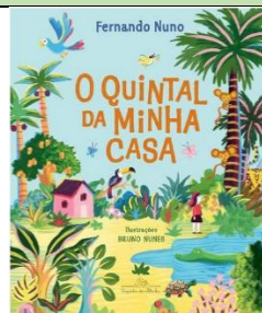
O quintal da minha casa Editora Companhia das Letrinhas 1ª Edição Fernando Nuno (Autor), Bruno Nunes (Ilustrador)